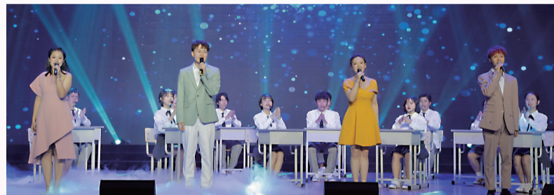
大学生艺术团表演阿卡贝拉歌曲《我的梦》。