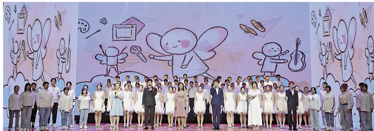
学生干部代表表演百人校歌大合唱《动感世界》。