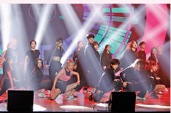
大学生艺术团表演街舞《动感青春》。