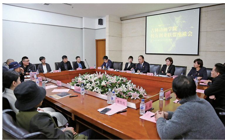
10月17日下午,2020年吉林动画学院校友创业联盟座谈会在吉林动画学院原创产业园二楼大会议室举行。

聚行业,搭建与社会各界交流合作平台,促进联盟与其他高校校友会、文创行业企业的多方合作,联合培育有孵化价值的创业成果。