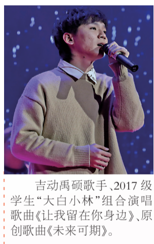
吉动禹硕歌手、2017级学生“大白小林”组合演唱歌曲《让我留在你身边》、原创歌曲《未来可期》。