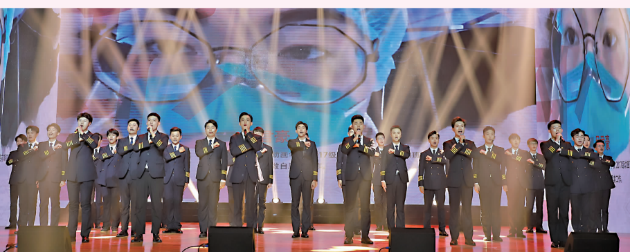
民航学院学生表演原创歌曲《战疫》。