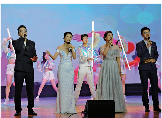
主持人和大学生艺术团表演歌舞《青春畅想》。