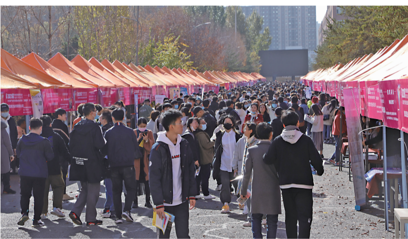
10月17日,吉林省2021届高校毕业生就业洽谈会——文化创意产业类毕业生就业创业洽谈会在吉林动画学院举行。