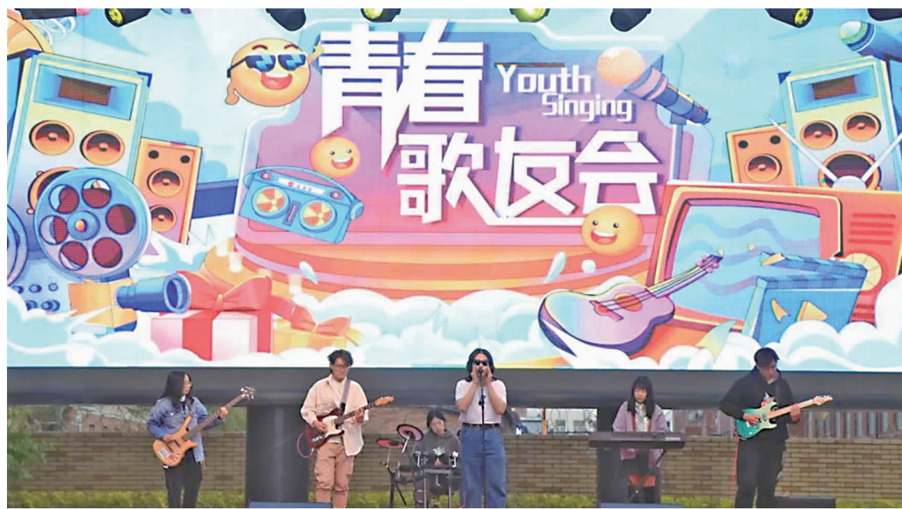
5月4日,“青春歌友会”在吉林动画学院中央大道图书馆前举办。