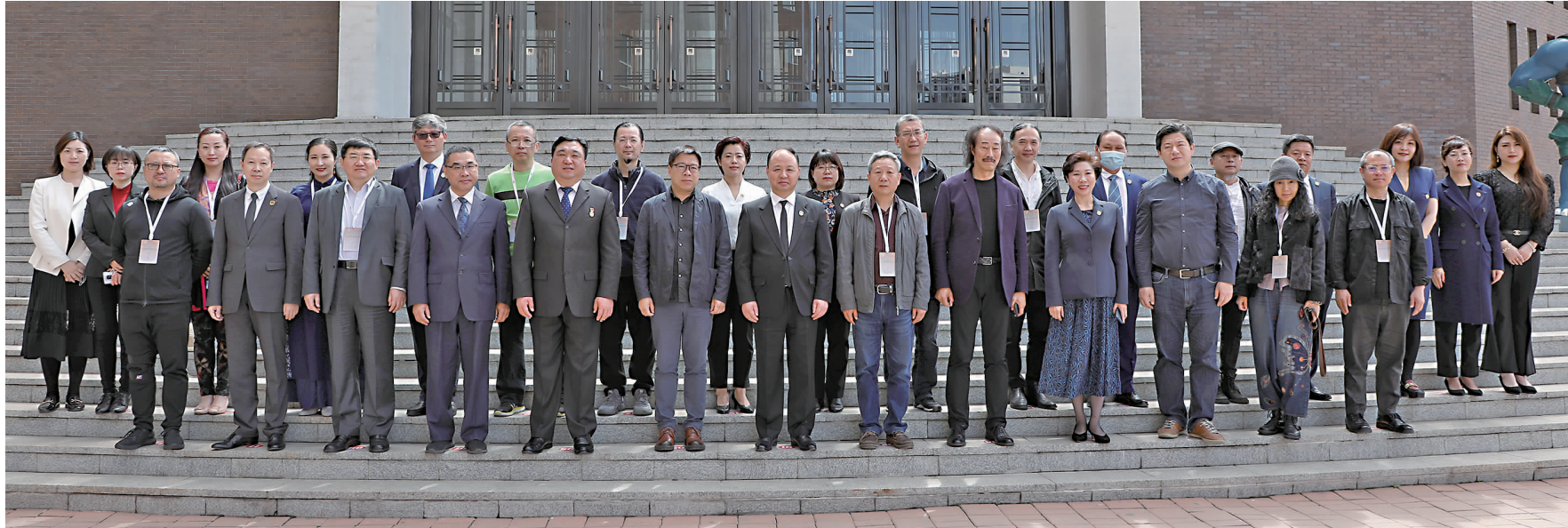
5月16日,2021吉林动画学院动画教育发展论坛隆重举行,校领导与专家合影。