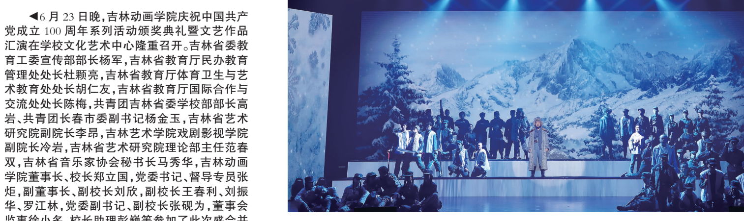
情景朗诵《松花江上》