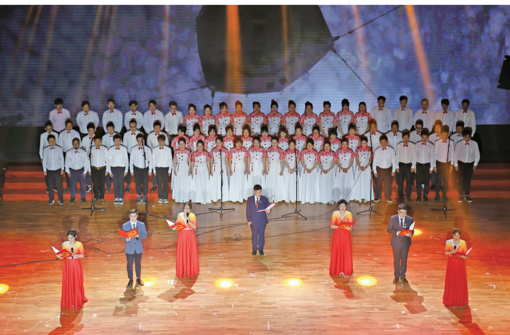
漫画学院、游戏学院、虚拟现实学院组成的“漫游虚拟世界队”表演了精彩的文艺节目。