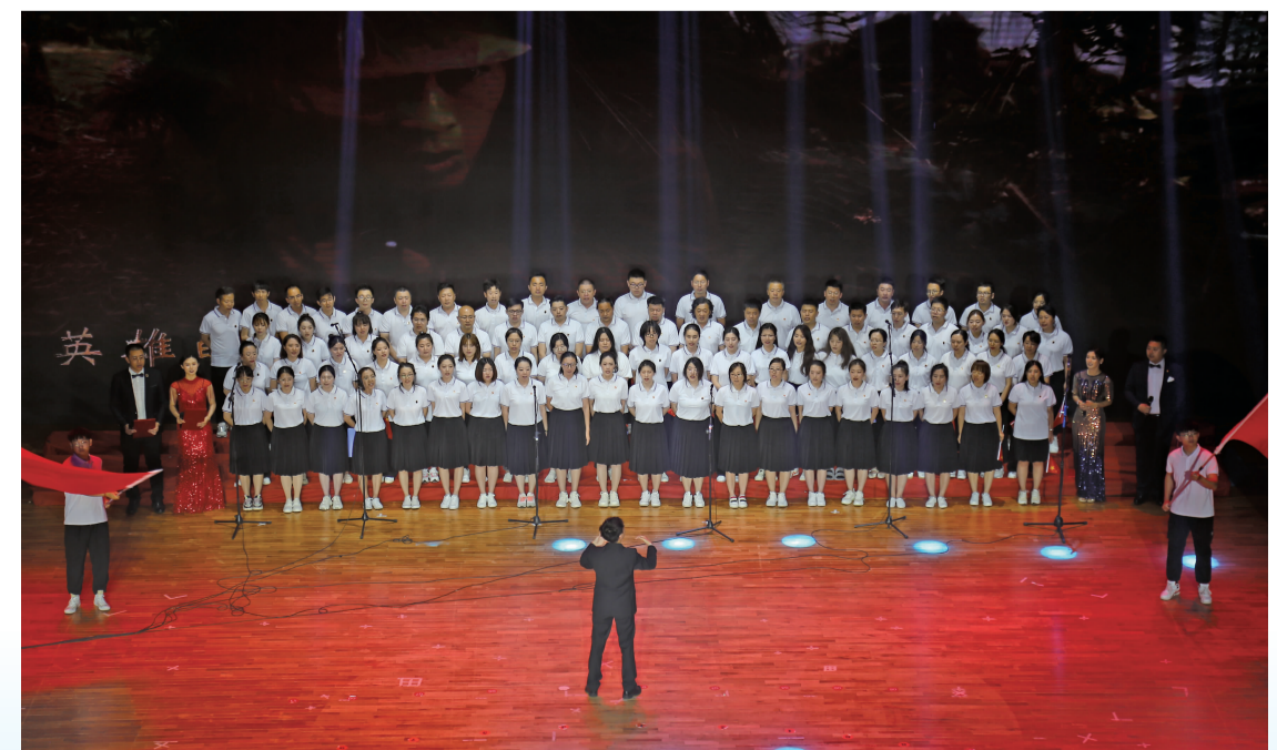
动画艺术学院、国际影视特效学院组成的“动乐合唱团”表演了精彩的文艺节目。