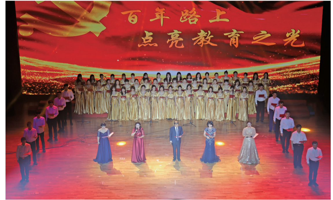
马克思主义学院、国际交流学院、通识教育学院、民航学院组成的“融合之队”表演了精彩的文艺节目。