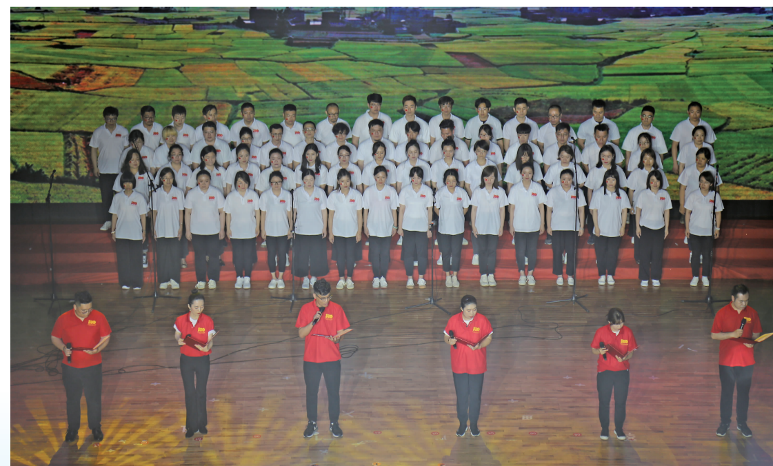
设计学院(含基础部)、产品造型学院组成的“砥砺前行队”表演了精彩的文艺节目。