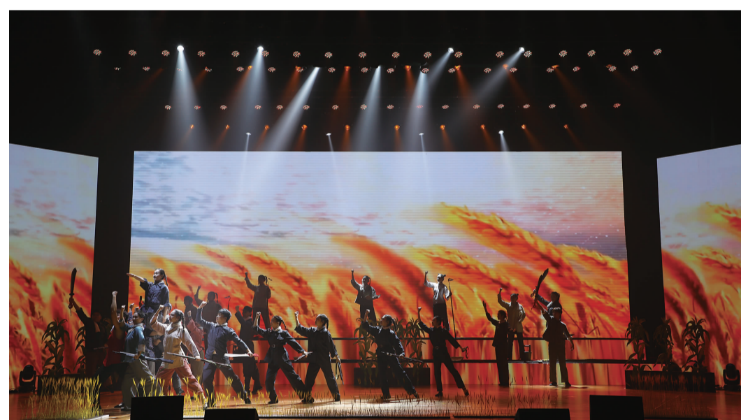
情景表演《游击队之歌》