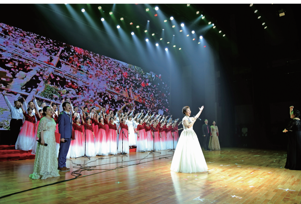
人力资源开发与管理中心、校务部等职能部门组成“吉动力先锋队”表演了精彩的文艺节目。