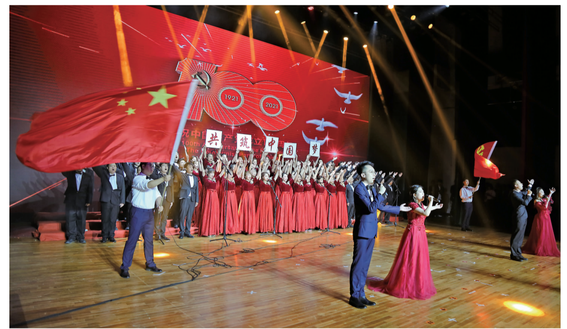
吉动文化艺术集团“筑梦前行队”表演了精彩的文艺节目。