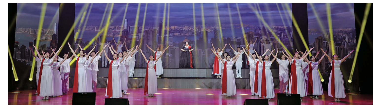
歌曲联唱《天耀中华》