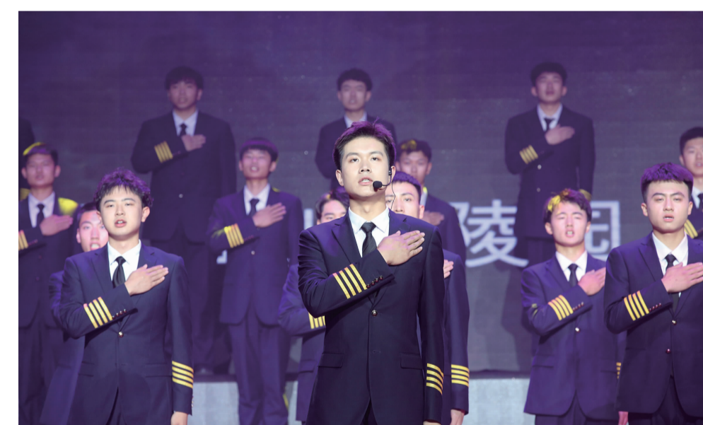
合唱《祖国不会忘记》