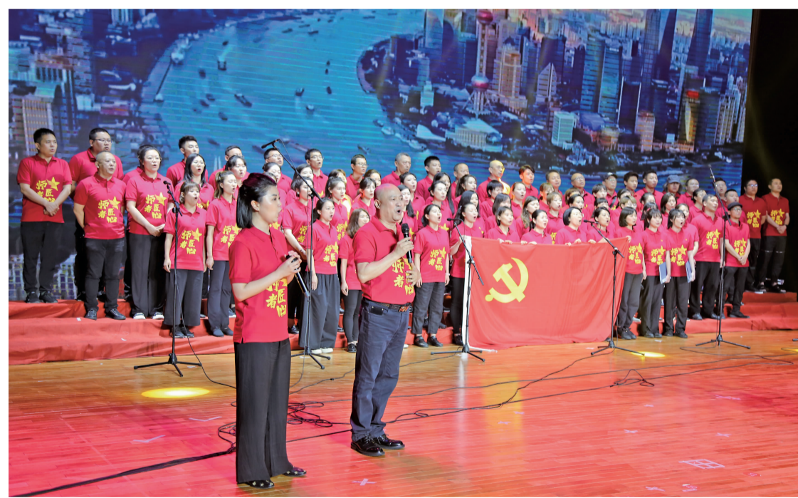
电视与新媒体学院、文化产业商学院组成的“文眸视闻队”表演了精彩的文艺节目。