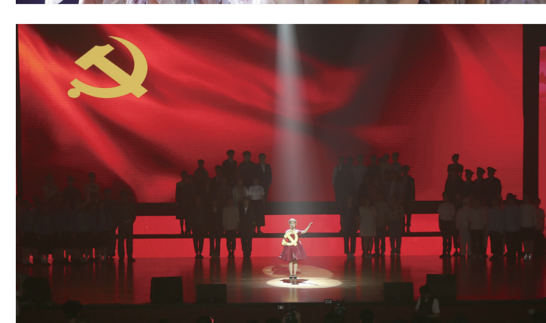
独唱《唱支山歌给党听》