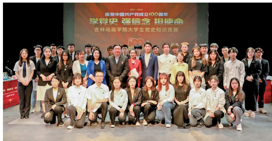
国家……”经过激烈角逐,国际影视特效学院代表队以总分225分的优异成绩获得第一名;设计学院代表队以总分180分获得第二

名;电影学院代表队和影视造型学院代表队都获得了170分,最后两队通过加试一题,电影学院代表队取得10分胜出,获得第三名。