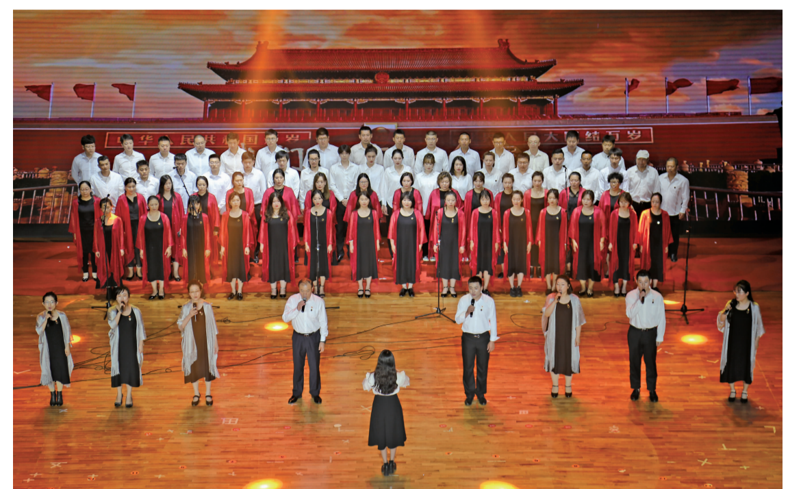
电影学院、影视造型学院、体育俱乐部组成的“型影艺体队”表演了精彩的文艺节目。