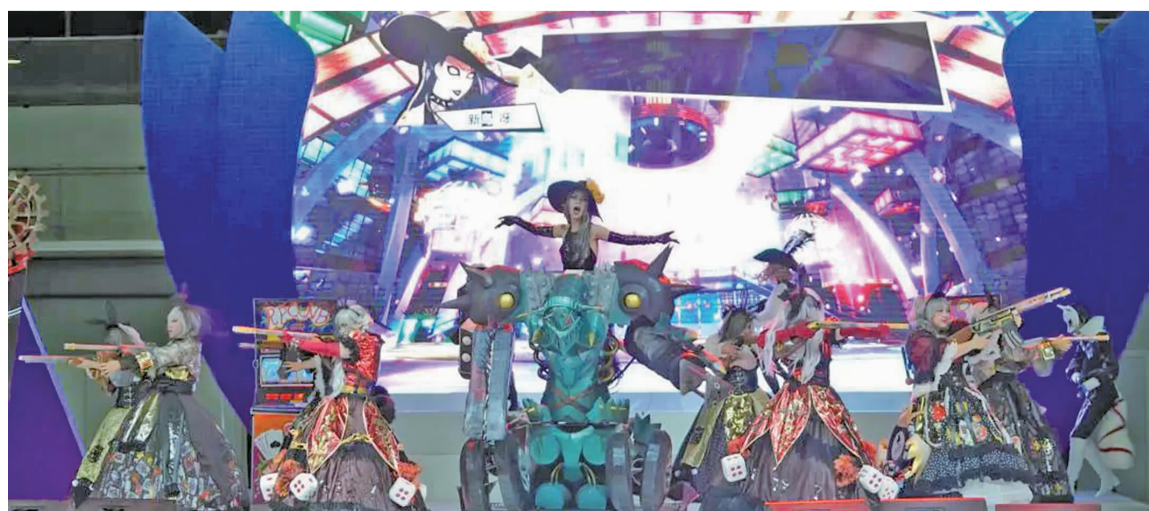
7月30日至8月2日,第十九届中国国际数码互动娱乐展览会(ChinaJoy)在上海新国际博览中心圆满举办。吉林动画学院 RPG 零式动漫社喜获 ChinaJoy Cosplay 超级联赛全国总决赛金奖。

RPG 零式动漫社成立于2016年,社团核心理念是:颠覆概念,创造趣味。以趣味创新为中心提供专业化的内容输出,形成以创新为核心的竞争优势,以创新的理念和大众化方式推动ACG舞台圈潮流。再度获得ChinaJoy Cosplay 超级联赛全国金奖,是RPG零式动漫社全体社员同心协力努力付出的结果,未来希望RPG零式动漫社能走得更高,看得更远,获取更多好成绩。(于明明)