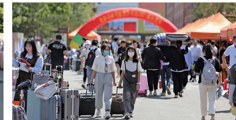
2021年,吉林动画学院新生报到现场。

在新生报到现场,学校在校门口为家长们设置了休息区,内有矿泉水、椅子、口罩等用品。因疫情原因,家长无法进校,学校安排各学院院长、系主任和学科带头人,专门解答学生家长提出的有关教学、人才培养等问题。当家长们看到学校安排志愿者帮助每个新生提行李,耐心解答他们提出的各方面问题,家长们觉得学校安排得真是贴心,让他们感到非常安心。“我们从上海来的,我们全家都希望他留在本地,但他自己坚持来吉林动画学院,就想学习动画,希望四年后儿子能够成就自己的动画梦想!”来自上海的学生家长赵先生说,虽然没能走进校园,但是看到这么多老师和志愿者在帮助孩子,放心了许多。