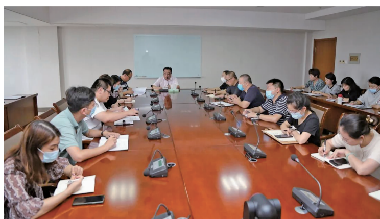
8月18日,我校召开2021秋季开学疫情防控工作部署会议,就2021年秋季开学疫情防控工作进行详细部署。

会上,张砚传达了近期上级关于疫情防控有关文件要求,由吉林省教育厅发布的《重点场所重点单位重点人群新冠肺炎疫情常态化防控相关防护指南》,中共长春市委教育工作委员会、长春市教育局发布的《关于做好2021年秋季学期校园疫情防控工作的通知》,并根据我校开学保障工作领导小组的安