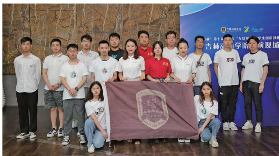
8月4日至5日,“建行杯”第七届吉林省国际“互联网+”大学生创新创业大赛落下帷幕,吉林动画学院获得“5金6银7铜”的好成绩。参赛团队成员合影留念。(张术摄)

继续厚植创新创业土壤,汇聚创新动能,继续加大创业服务保障,全面构建学生共创、校友共创、师生共创的多维双创格局,推动我校“联合创业、融合发展”创新创业大体系的建设。全面推进服务地方经济和社会发展,为国家培养具备创新精神、创造能力、创业意识的优秀创新型人才。(刘子瑞)