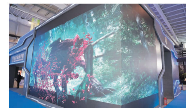
2021年9月23日,我校高科技产品裸眼3D惊艳第十三届中国—东北亚博览会。

科技创新能力的提升是吉林动画学院一贯坚持的基本工作理念之一,学校不断加大科研投入,引进国内外领军人才,吸纳一批知名专家,构建了结构合理的高水平科技创新队伍。先后获批吉林动漫文化研究基地、工程