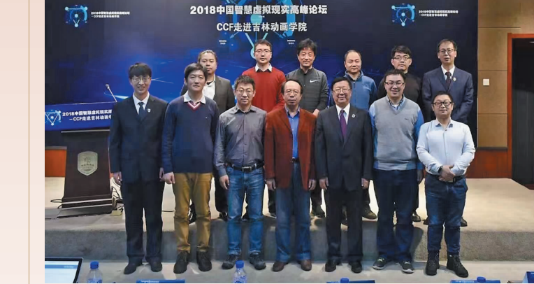
虚拟现实学院承办2018中国智慧虚拟现实高峰论坛。