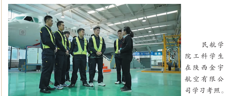
民航学院工科学生在陕西金宇航空有限公司学习考察。

民航学院飞行器动力工程、飞行器控制与信息工程、飞行器制造工程专业:3个航空航天类专业分别培养航空机械维修、航空电子维修和无人飞机制造与应用民航应用型人才。以岗位需求为导向,确定人才培养质量标准,聚焦人才供需高度契合,采取“校企合作、产教融合”办学模式和“国标+行标、学历+执照”人才培养模式。学生持证率高,深受民航企业欢迎,具有很强的就业竞争力,就业质量高。同时加强学生管理,建立了民航化管理体系,注重作风养成,强化安全意识,培育民航精神,为学生提前植入民航基因,完成文化重塑。学生毕业时既能获得本科学历证书,又可取得民航岗位相关执照,把学生提前培养成为具有民航局认证资质的应用型人才。表演专业(空中乘务方向)专业:面向民用航空产业需要,聚焦艺术素养和乘务素养“兼备”,强化外延与内涵“兼优”,突出大学4年全程“三个不断线”的人才培养特色,即形体塑造不断线、礼仪培育不断线、语言培养不断线。培养符合民航服务质量标准,人才供需高度契合,深受航空公司欢迎。具有良好的人格道德修养、人文艺术素养和乘务素养及宽阔的国际视野。具备相应的广播播报能力,较强的汉英语言交流能力,人际沟通能力、团队合作能力,能在国内外航空公司胜任空中乘务工作的高素质应用型人才。