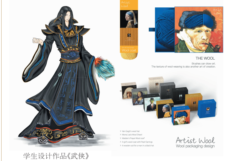
学生设计作品《武侠》

产品设计专业:2021年获批吉林省一流专业建设点。以“文化创意产品设计”“交互与智能产品设计”等特色专业为发展方向。本专业根据国家设计产业发展战略,结合产品设计的方向,依托吉林动画学院“学-研-产”一体化办学特色,树立与产业需求深度融合的双创人才培养理念,形成了以“文化创意产品设计”“交互与智能产品设计”等特色专业发展方向。自专业成立以来创造许多佳绩,师生共创的动漫衍生产品设计项目市场转化率逐年提高,学生积极参与的工业设计大赛、红点、PINUP等国内外学科竞赛获奖近百项,中国互联+大学生创新创业大赛吉林赛区金奖2项、银奖2项、铜奖3项。服装与服饰设计专业:面向影视产业及服装产业相关领域发展需求,培养具备扎实的服装设计基础理论知识和服装工艺专业技能,掌握较强的服装原创设计能力、人物造型设计能力、影视专业应用能力,能胜任影视剧组、剧团、服装公司、高级定制工作室、时尚机构等相关工作的高素质应用型人才。