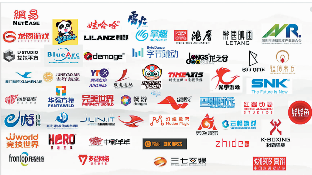
学校与多家国内行业领军企业开展战略合作或达成了稳定的人才供给关系。