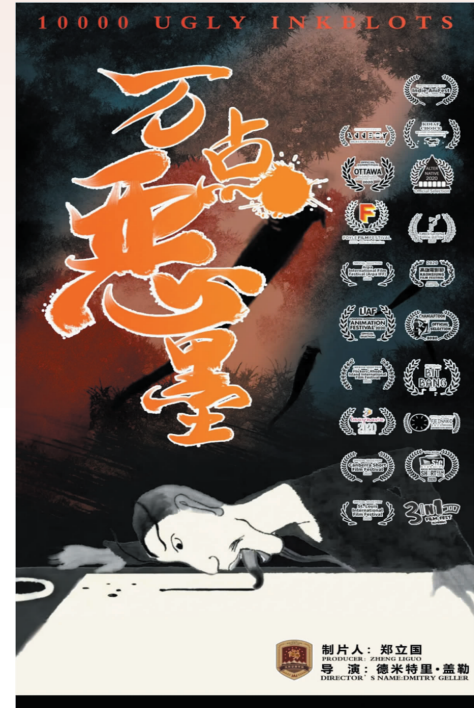
2019年,俄罗斯著名动画导演德米特里·盖勒到我校指导学生创作动画短片《十万点恶虫》,成功入围2020年法国昂西国际动画电影节。

俄罗斯苏兹达尔国际动画电影节、渥太华国际动画电影节上斩获大奖,并在中国动画学会“美猴奖”、上海“白玉兰奖”、厦门国际动漫节“金海豚奖”等重量级赛事中频频斩获国内动画最高奖项。二 维动画专业方向主要根据国内外动画行业发展趋势与人才需求,在继承传统二维动画制作技术的基础上,构建二维动画“全流程”动画艺术创作课程体系,设置动画文学编剧、动画导演创作、前期美术设计、动画表演、数字合成与特效、动画制片与管理等课程,从而培养适应信息技术时代发展,具备较高的动画行业职业素养、艺术修养与文化底蕴、团队协作与创新精神,能在动画、影视、游戏、广告等行业的领域中,胜任动画导演、前期美术设计师、原画设计师、影视后期合成师、动画管理与营销等工作岗位的动画艺术人才。三 维动画专业培养具有良好影视修养、动画制作与设计的能力。符合产业电影、动画系列片、特效电影、特种电影的创作技能。掌握数字化美术基础知识、视效预览以及三维动画的制作知识。具有较高审美能力,较强的产业化创作技能,能从事三维动画创作、三维游戏制作,交互式动画、数字化相关领域制作的动画艺术人才。新媒体动画培养学生理解数字动画与新媒体艺术与技术特征、传播方式及产业规律,以新媒体艺术设计、图形动画设计、数字动画技术、用户交互设计、交互技术与应用为核心课程。掌握创意策划、动画制作、交互动画以及UI设计等工作所需要的专业技能,以数字技术为支撑,以新媒体为主要载体,满足应用型动画、新媒体交互影像、游戏视效等相关行业对动画艺术人才的需求。