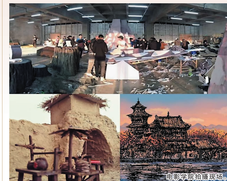
电影学院拍摄现场。

戏剧影视美术设计系专业:依托我校“产学研”一体化办学定位,遵循“三个注重”人才培养思路,下设影视美术设计、人物造型设计两个专业方向,构建符合影视行业交叉需求的特色课程体系和教学模式,注重学生综合能力和职业发展能力的培养。近些年,骨干教师完成教科研项目20余项,发表论文40余篇,编写出版专业教材4本,参与网络大电影7部、微电影20余部。戏剧影视文学专业:重点培养动画、影视方向的剧本创作人才,提升学生的文学艺术修养和创作能力,培养学生成为一名优秀的剧本创作者。本专业师资力量雄厚,有国家一级编剧李雪艳、戏剧与影视学教授李中华等行业专家和教学名师。师生作品多次获奖。如学生创作的话剧《2012我们等待太多》获中国校园戏剧节优秀剧目奖;2017年原创话剧剧本《疯人院的莉莉玛莲》获第三届全国校园剧本征集比赛一等奖。