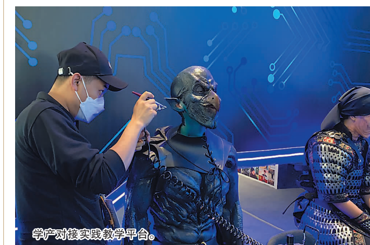
产学研对接实践教学平台。

为满足国际国内电影产业未来发展和行业应用对于影视特效人才的迫切需求,电影技术学院依托与新西兰媒体设计学院共建的国际影视特效学院和国家一流本科专业建设点“动画专业”的建设基础和雄厚资源,开设了动画专业特效特效、数字特效、虚拟特效三个专业方向,并与新西兰媒体设计学院围绕动画专业影视特效方向共建了中外合作办学项目。面向电影工业化体系,强化电影技术对电影制作的技术支撑,深化动画、电影、虚拟现实技术交叉学科的融合。依托与维塔数码(新西兰)、工业光魔等行业一流的国际资源优势,建设由国内外专家组成的师资队伍,搭建以市场高端影视项目为主体的产学研对接实践教学平台,培养符合国内外电影产业需求的高端电影技术人才。