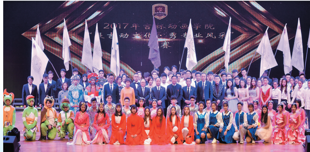
2017年12月20日,吉林动画学院2017“展动画文化·秀专业风采”大赛隆重举行。校领导、嘉宾与部分演员合影留念。