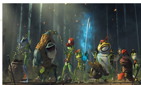
我校3D动画电影《青蛙王国》剧照。

动画产业学院依托我校动画专业的雄厚建设基础和丰富的优质资源,建设涵盖影视动画工业化体系全流程的动画专业(影视动画方向)。本专业方向立足于国际影视动画产业未来发展,以成果产出为导向,以深化产教融合为理念,赓续传承“产学研一体化”的办学特色,“聚焦国际、突破传统、学科交叉、五育并举”,注重内涵建设,强化特色发展;坚持以高端产业项目引领教学,按照国际影视动画产业的真实环境搭建产学研对接实践教学平台,将工业化生产流程和管理模式引入实践教学,实现课程内容与行业标准、教学过程与生产过程的紧密对接,构建成分阶段、