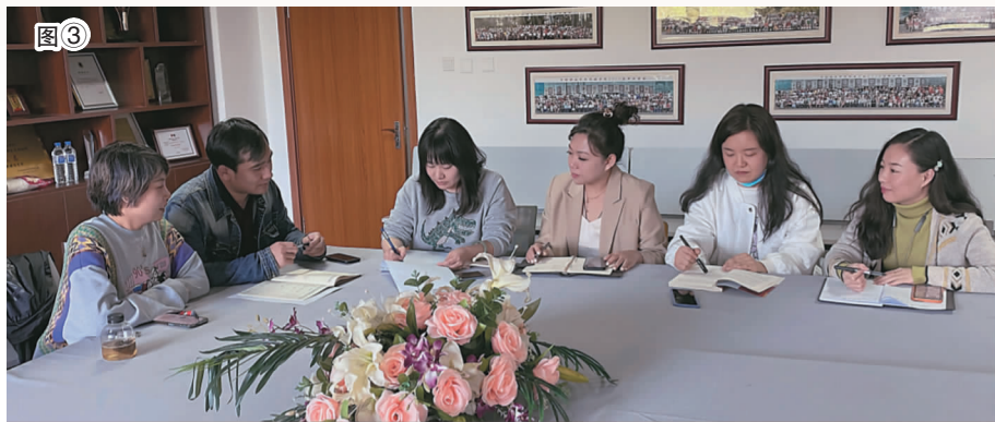
图1 动画艺术学院《动画原理》课程团队——2021年度吉林省一流本科课程。 图2 漫画学院《漫画角色设计》课程团队——2021年度吉林省一流本科课程。 图3 电影学院《新媒体视听产品策划、制作与推广实践》课程团队——2021年度吉林省一流本科课程。

学过程与产业实践对接、学生综合素质与职业需求对接。获批省级一流本科课程9门,省级精品在线开放课程4门,省级校企合作开发课程3门,省级创新创业教育改革示范课程3门,省级学科育人示范课程2门,省级课程思政示范课程1门、建设课程2门,省级精品课程6门,省级优秀课程19门。