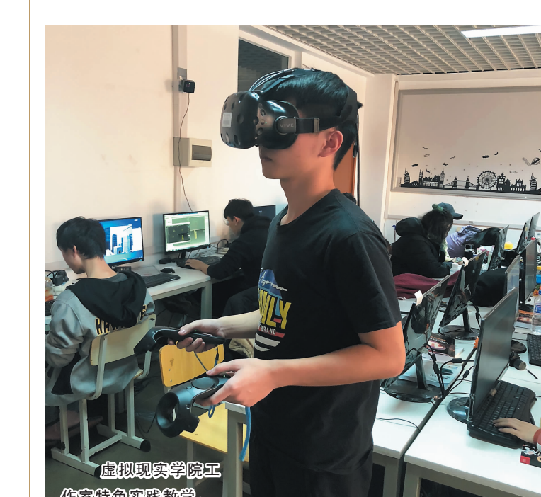
虚拟现实学院工作特色实践教学。

数据科学与大数据技术专业:研究大数据关键技术,涵盖数据存储、处理、应用等多方面的技术。结合虚拟/增强现实开发、智能交互、游戏引擎开发、Web+App+AI、5G+VR+AI等技术,数据科学与大数据技术可以应用于电商、政府、医疗、传媒、安防、金融、电信、教育、交通等领域。